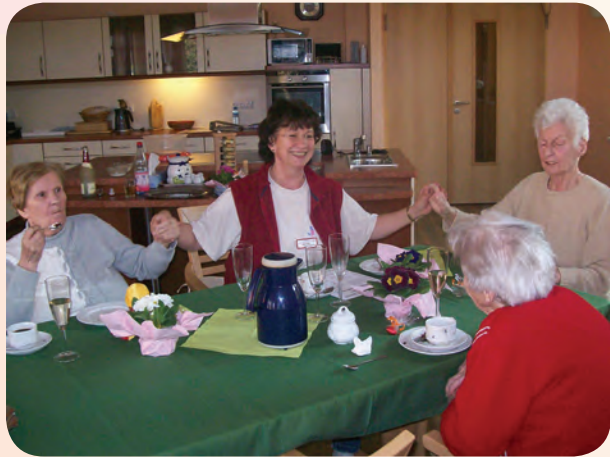
Die Wohnküche ist der zentrale Ort jeder Hausgemeinschaft

Speziell ausgebildete Alltagsbegleiter sind das organisatorische „Familienoberhaupt“. Tagsüber präsent, gestalten sie mit den Bewohnern den Tagesablauf.