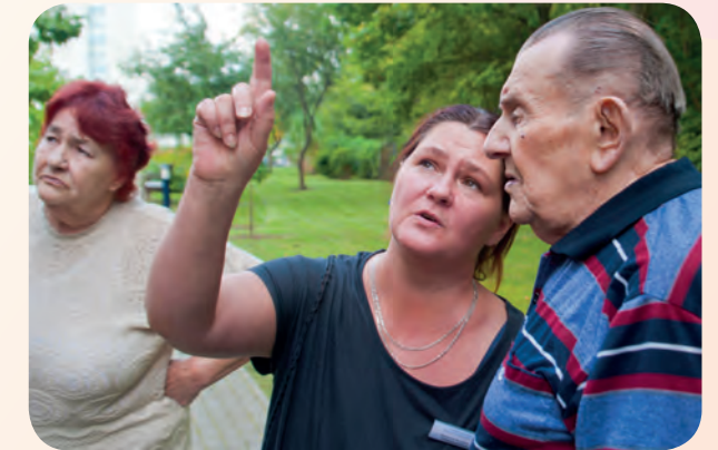
Wenn Sie Lust haben, uns kennenzulernen, freuen wir uns, Sie hier begrüßen zu können.