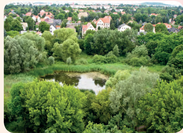
Der Rohrpfuhl, direkt hinter dem Wohnpark gelegen

Die Verbindung zur Natur betrachten wir als wichtigen Lebensbestandteil. Ein eigener, schön angelegter Hausgarten mit Obstbäumen, Beerensträuchern und Kräuterbeeten wird von den Bewohnern genutzt und mitgestaltet.