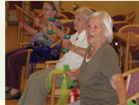
Kraft- und Balance-Training