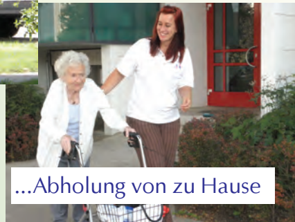
...Abholung von zu Hause

Die Tagespflege trägt wirksam dazu bei, dass ▶ ältere pflegebedürftige Menschen möglichst lange selbstständig zu Hause leben können, ▶ sie dabei nicht auf eine angemessene Betreuung und Pflege verzichten müssen, ▶ sie professionelle Unterstützung und Beratung in Krisensituationen erfahren und ▶ sie über die Leistungen der Tagespflege und darüber hinaus umfassend beraten werden.