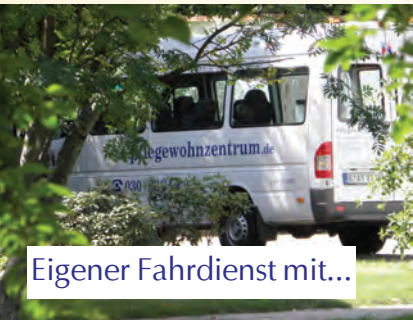
Eigener Fahrdienst mit...